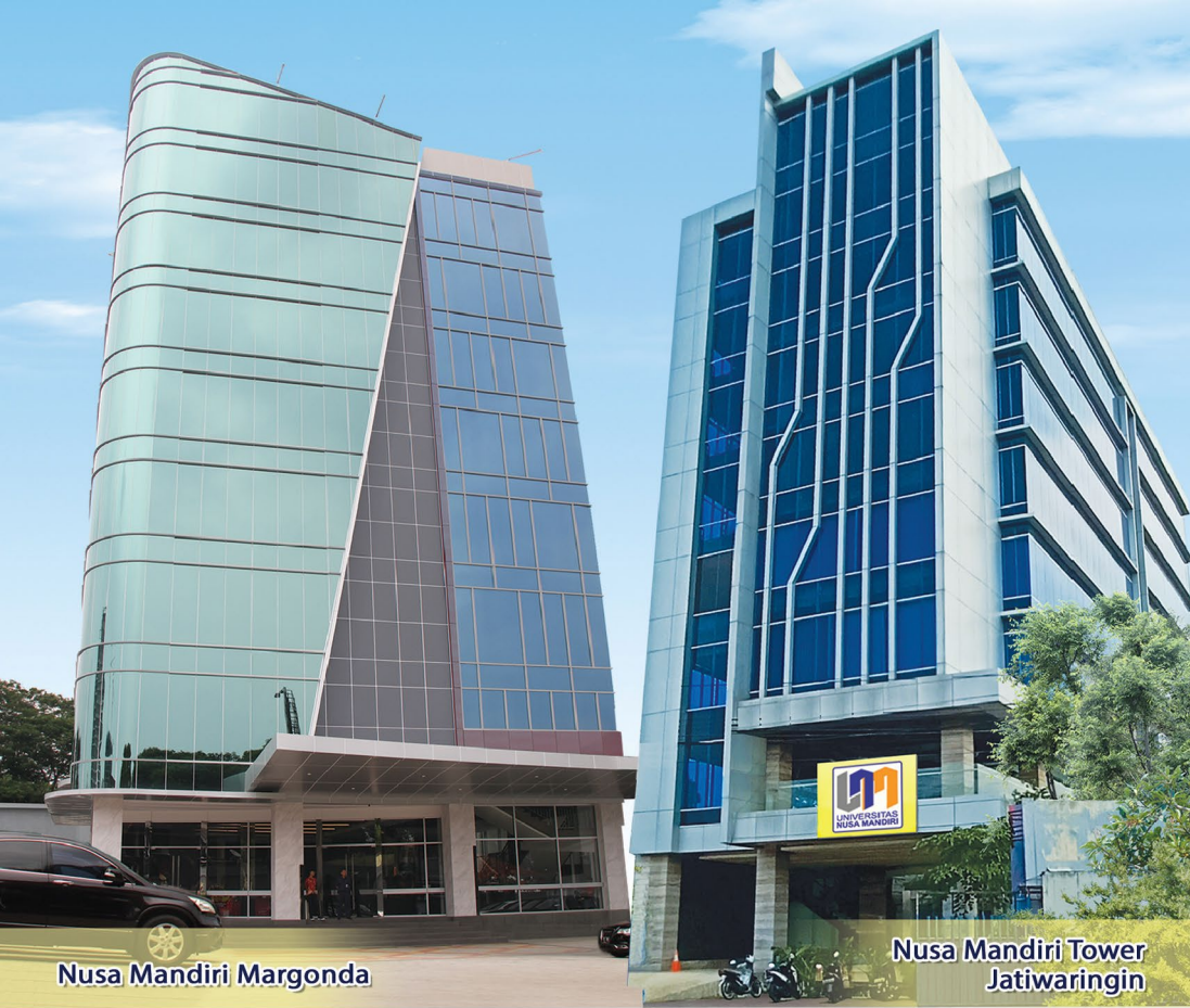
Nusa Mandiri Margonda