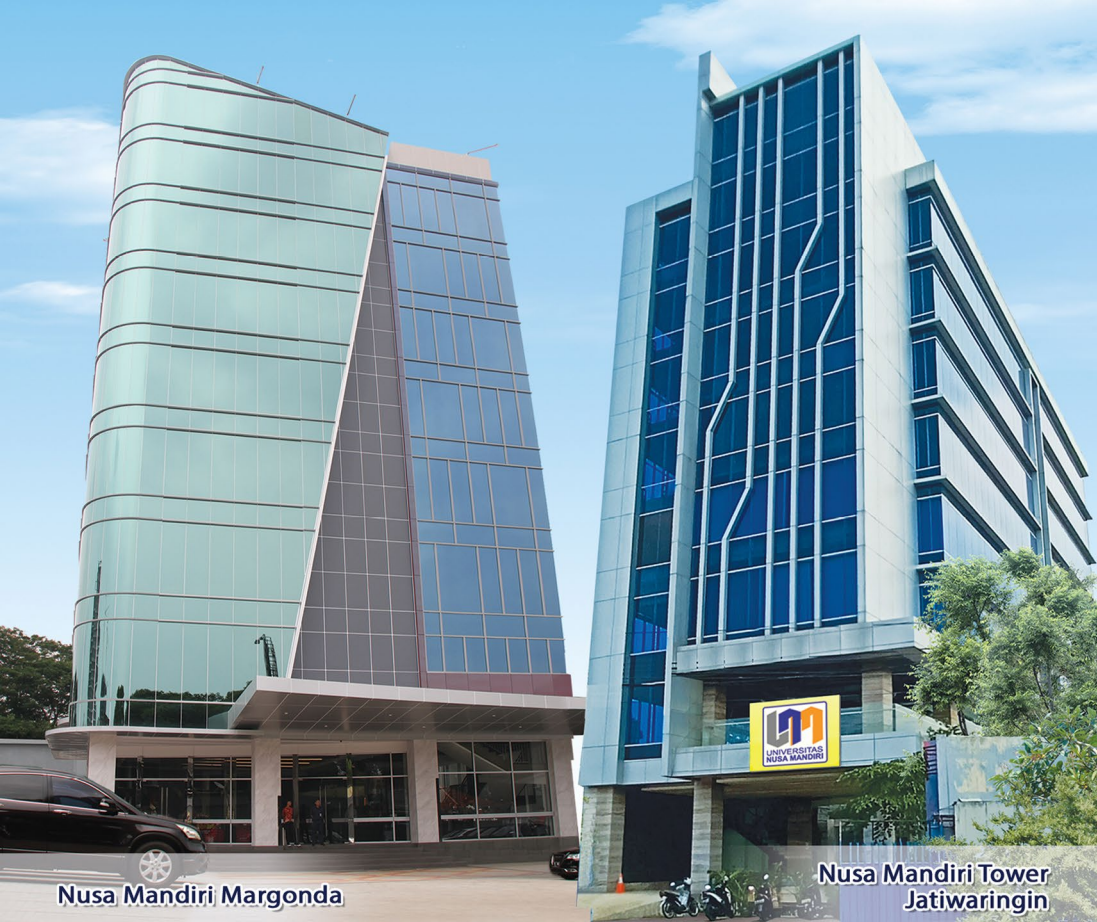
Nusa Mandiri Margonda