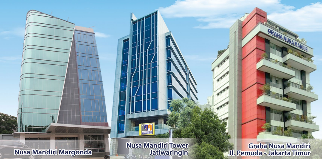
Nusa Mandiri Margonda